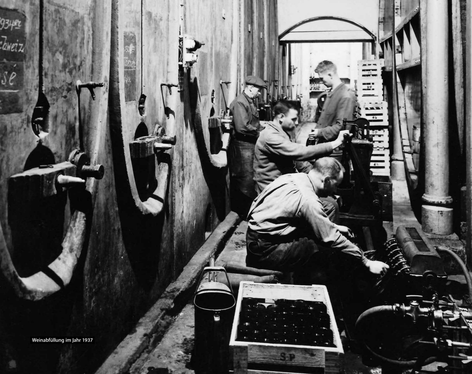
Weinabfüllung im Jahr 1937