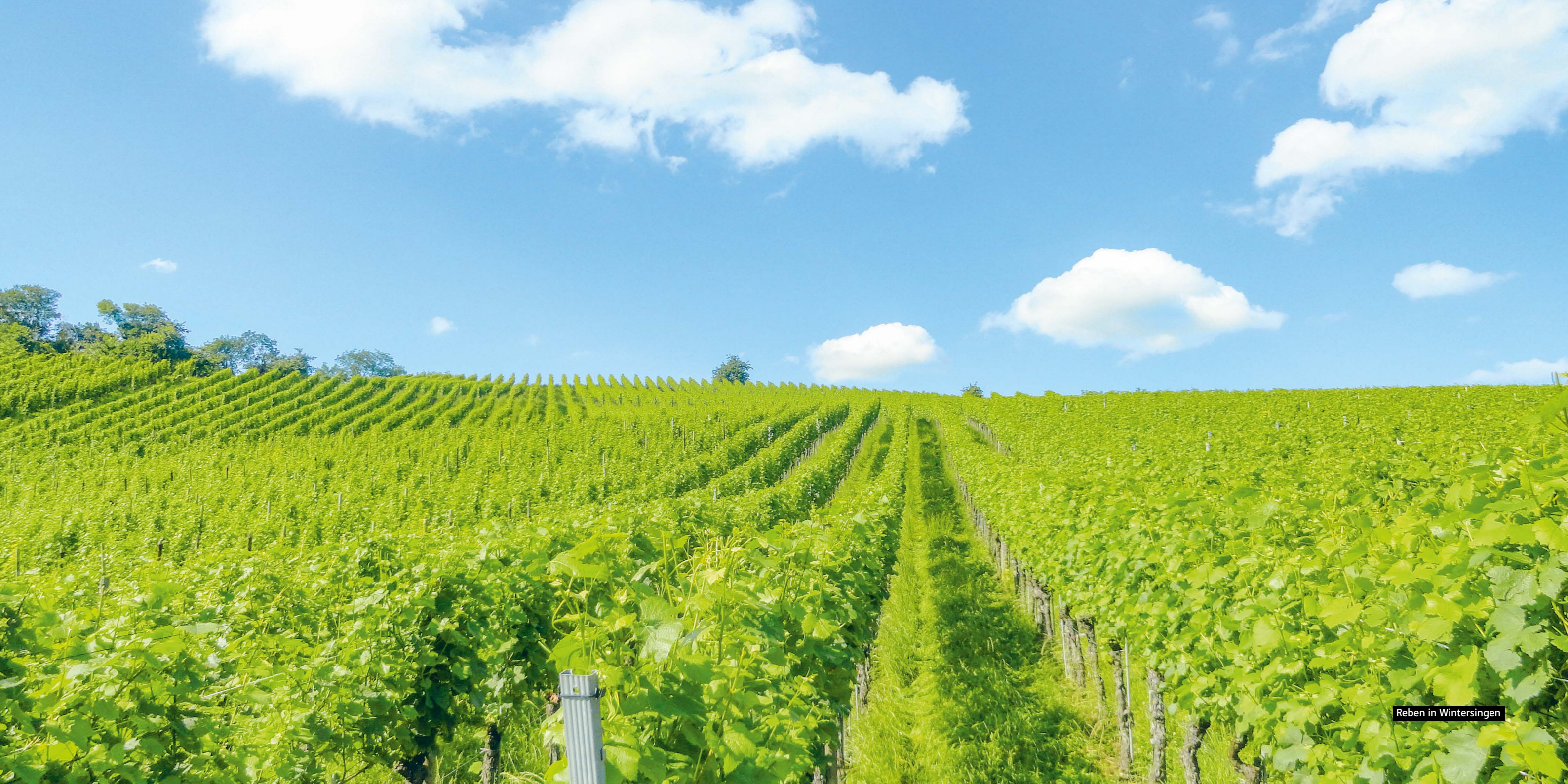
Reben in Wintersingen