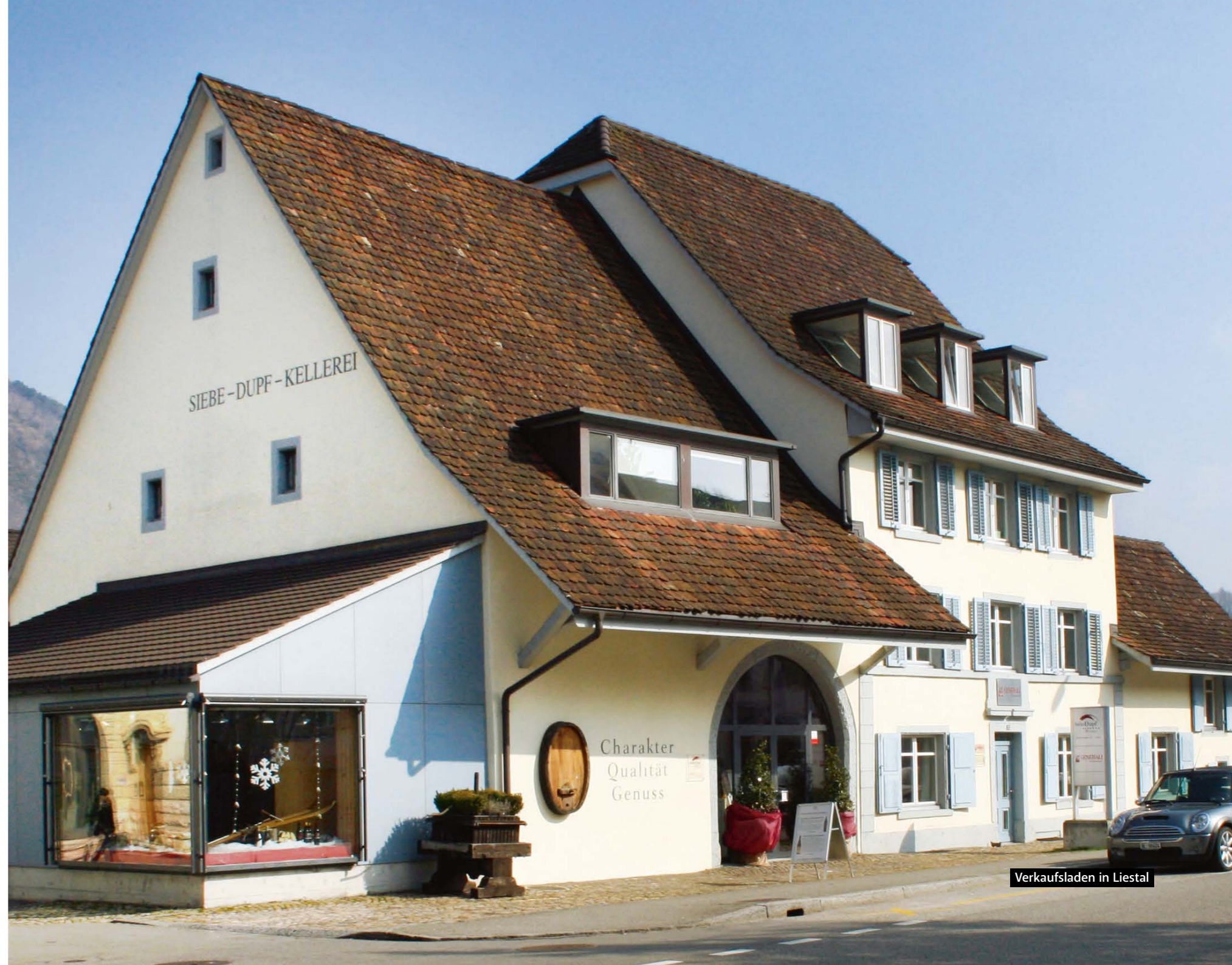
Verkaufsladen in Liestal