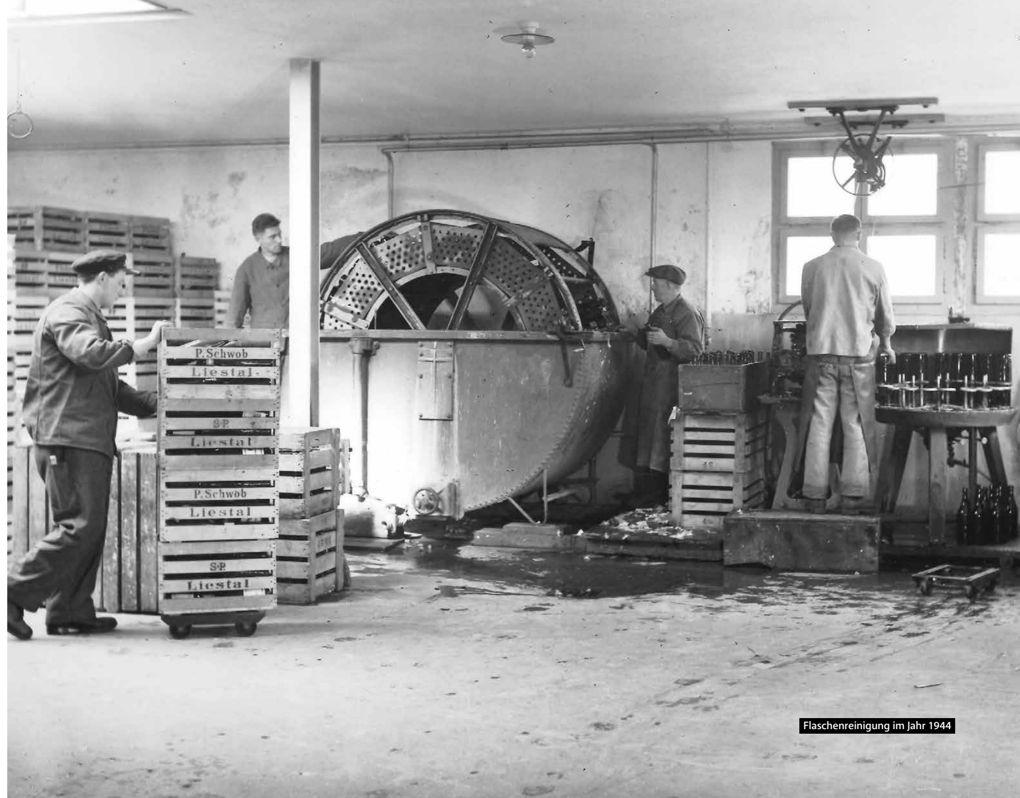
Flaschenreinigung im Jahr 1944