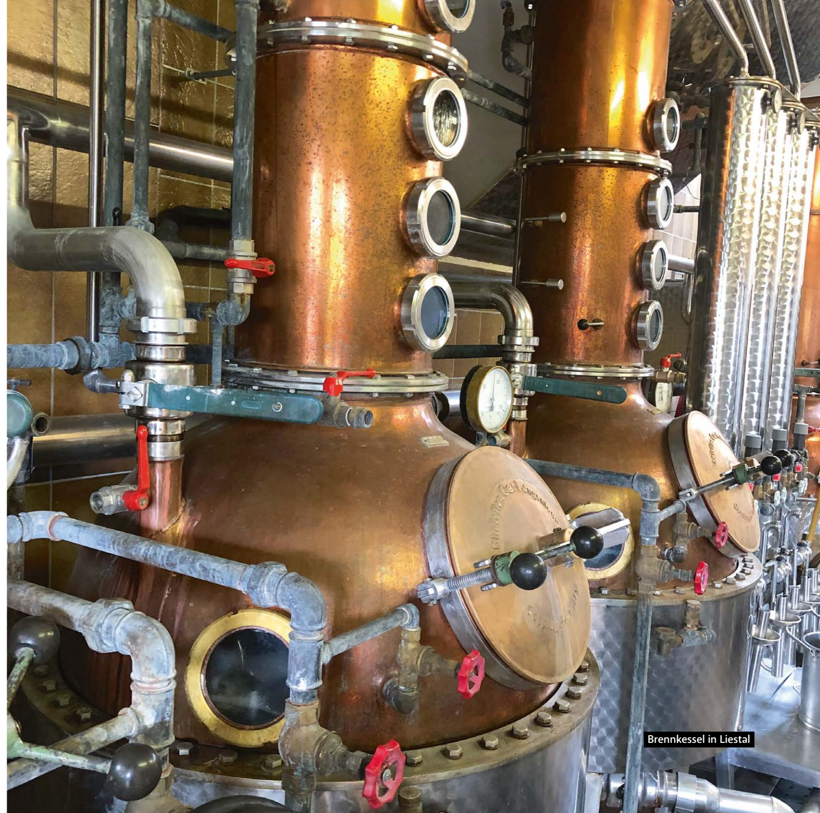
Brennkessel in Liestal

Beschrieb: Mit dem Jahrhundertjahrgang 2018 wurde in der Siebe Dupf Kellerei erstmals Kerner-Trester separat zu diesem klaren Kernerbrand destilliert. Entstanden ist ein äusserst eleganter und fruchtbetonter Marc mit Aromen von exotischen Früchten, Muskat und weissen Blüten.