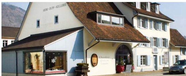
Die Siebe Dupf Kellerei 4