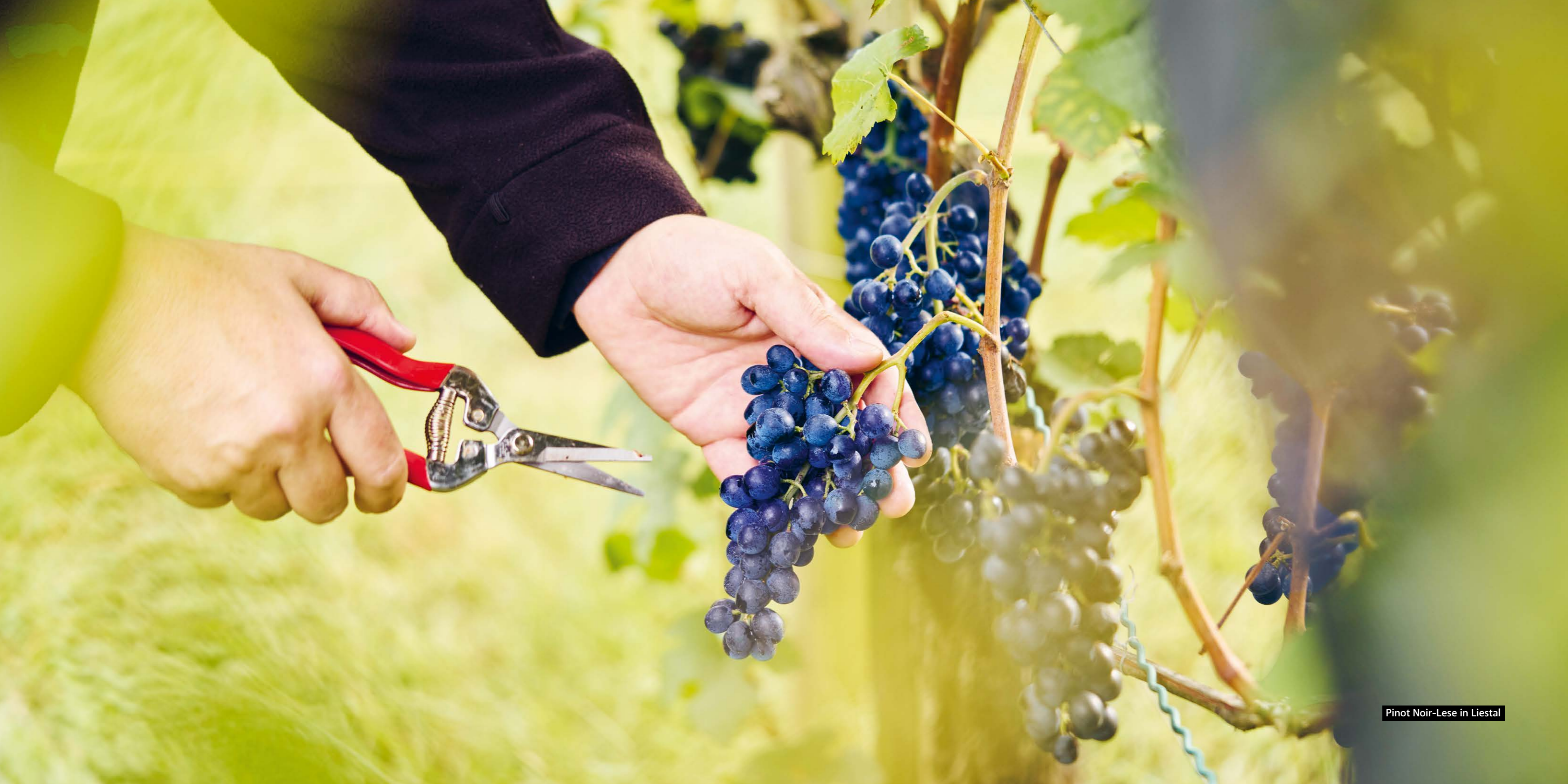
Pinot Noir-Lese in Liestal