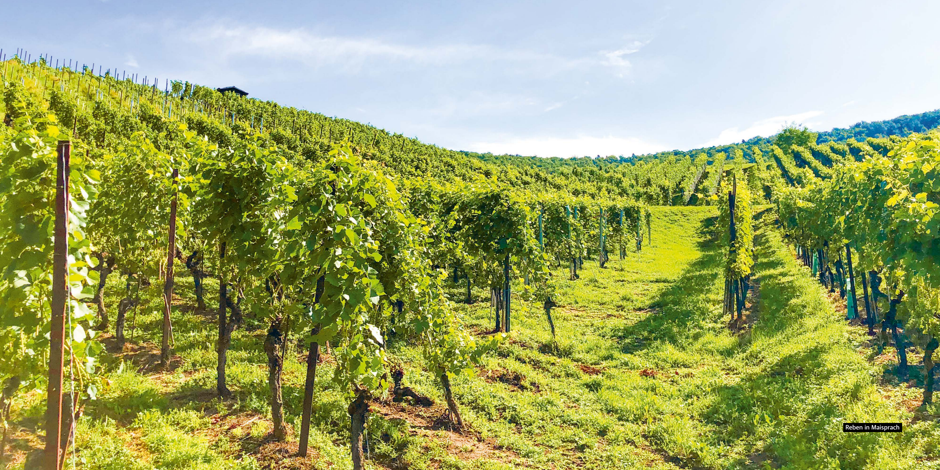
Reben in Maisprach