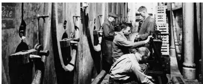
Weinbau im Baselbiet 11