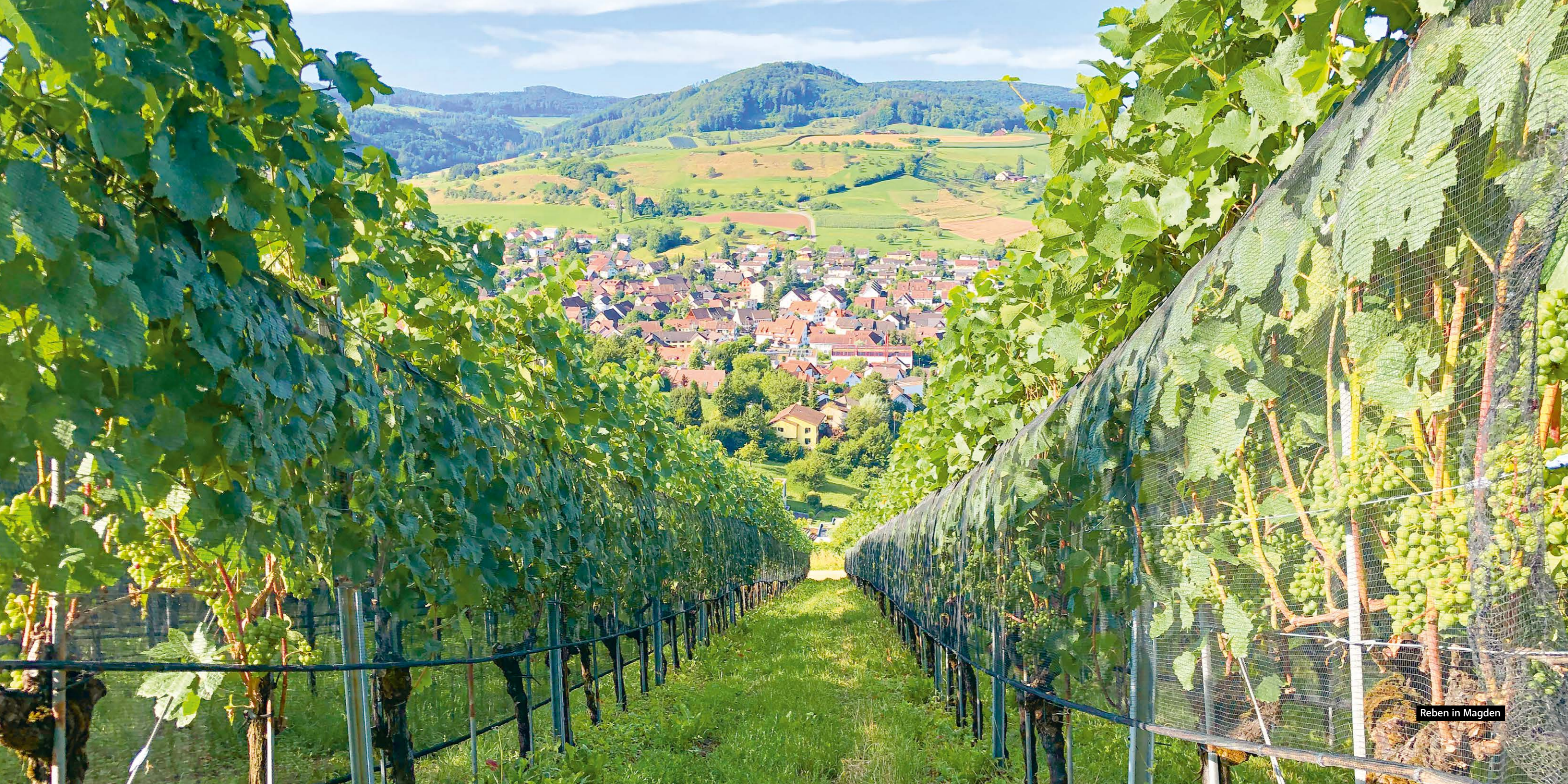
Reben in Magden