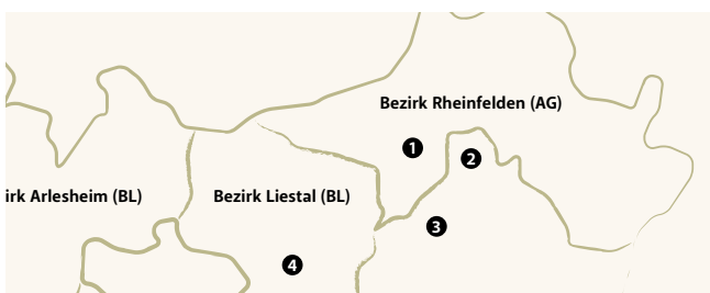
Unser Regio-Sortiment 12